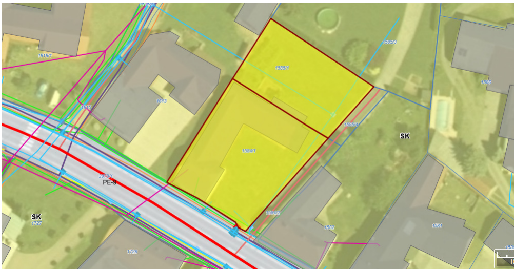
parc. št. 1584/1 in 1585/1 k.o. Odranci